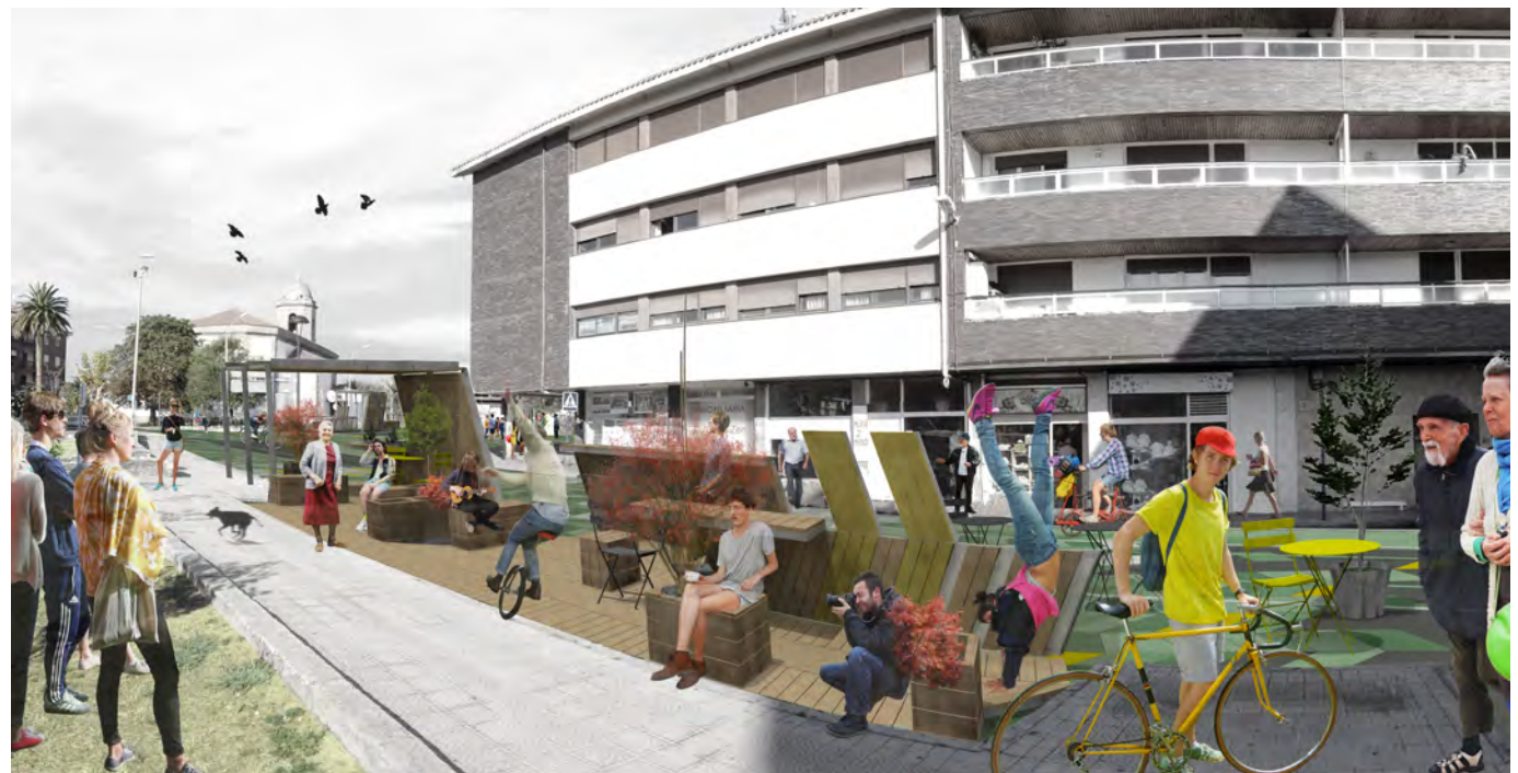
Proposatutako esku-hartze baten irudikapena. Simulación de una de las intervenciones propuestas.