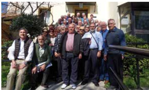
Reunión de los representantes de las Asociaciones de Bizkaia (NAGUSIAK) celebrada en Sopela el pasado 9 de marzo.

Halaber, ekainaren 3an Bizkaiko Nagusien Eguna ospatzen da eta okasiorako, Nagusiak, Lagun-Artearen laguntzarekin, Bizkaia osoko 1.000 jubilatu inguru bilduko dituzten ekintza ugari antolatu dituzte. Beste batzuen artean, nabarmentzekoak dira: autoritateen harrera, nekazar produktuen erakusketa eta dastatzea, bisita turistikoak kostaldetik, txu-txu tren, pailazoak, pilota partiduak, musika, etab. Zipiriñen egingo den jubilatuentzako bazkari herrikoia ere ez da faltako, eta azkenik, dantza goipuzak nahi edota ahal duenera arte.