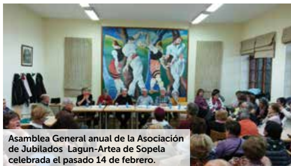
Asamblea General anual de la Asociación de Jubilados Lagun-Artea de Sopela celebrada el pasado 14 de febrero.