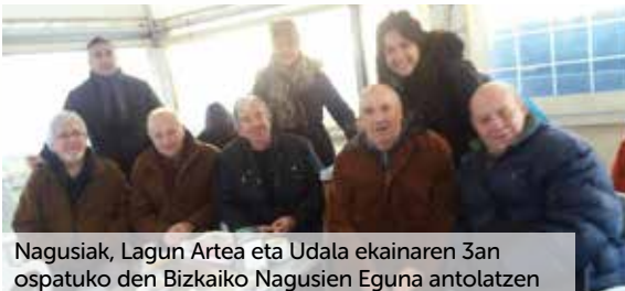
Nagusiak, Lagun Artea eta Udala ekainaren 3an ospatuko den Bizkaiko Nagusien Eguna antolatzen

El martes, 7 de marzo, se celebrará en la Asociación Lagun Artea un Concurso de Tartas organizado por la Asociación de Mujeres Itzartu y el día 30 se impartirá la charla "Mejora de la memoria".