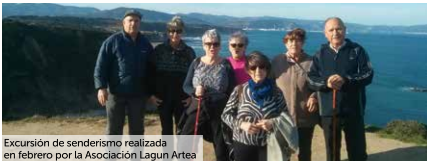
Excursión de senderismo realizada en febrero por la Asociación Lagun Artea

En la Hamada argelina, la zona más inhóspita del desierto del Sahara, cerca de 200.000 refugiados saharauis resisten en las más duras condiciones en las que pueda vivir un ser humano. En su mayoría, son niño/as, mujeres y anciano/as. La lucha del pueblo saharauí por el derecho a ejercer la libre autodeterminación y poder así regresar a su tierra, ilegalmente ocupada por Marruecos desde 1976, está siendo cruelmente larga. La Asociación Nuyum, dentro del Programa "Oporrak Bakean", os propone un verano solidario acogiendo durante los 2 meses de verano a un niño/a saharauí. Los 2 meses de verano son especialmente duros en los Campamentos de refugiados, con temperaturas que superan los 50º. Por ello es importante que podamos sacar al mayor número posible de niño/as. La experiencia de estos últimos 11 años nos dice que este acto de generosidad es mutuamente enriquecedor y contribuye a reforzar los lazos de solidaridad entre dos pueblos hermanos. Si quieres ayudar al pueblo saharauí, contacta con nosotros en el 695788185 y vive un verano solidario.