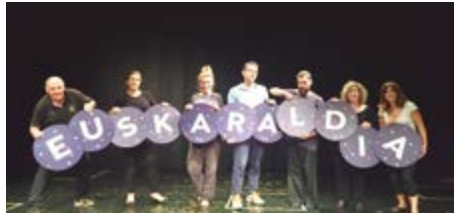
KALEKA ANTZERKI TALDEA