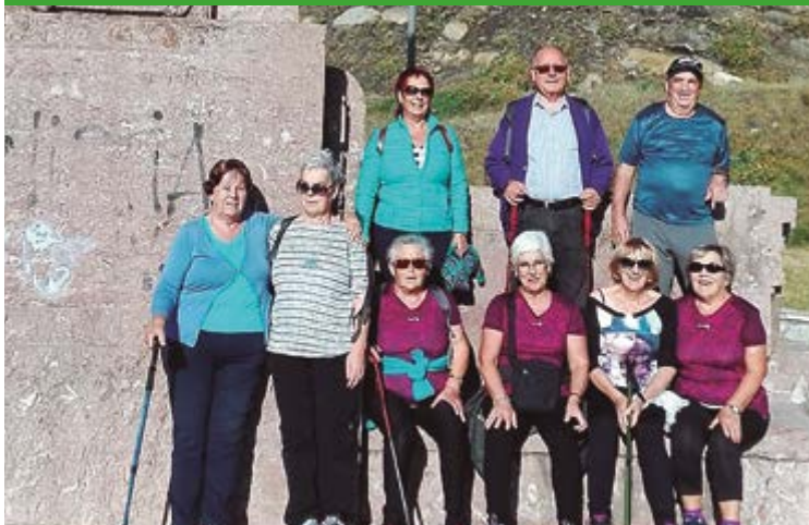
Salida a Plentzia del grupo de senderismo de Lagun Artea en octubre

La Asociación Lagun Artea ha organizado 3 actividades durante el mes de noviembre. Para comenzar, el día 4 celebrará la tradicional Misa de difuntos. Asimismo, en la primera quincena realizará una exposición micológica y para terminar, el jueves 15, preparará una gran chocolatada ambientada con música con motivo del Homenaje al Mayor.