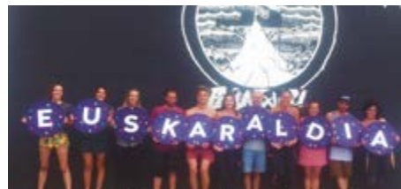
PEÑA TXURI SURF TALDEA