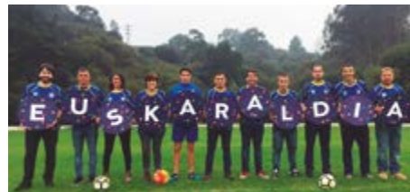
UGERAGA FUTBOL TALDEA