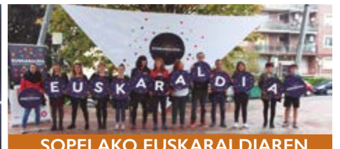
SOPELAKO EUSKARALDIAREN TALDE ERAGILEA