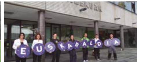
BEONE SOPELAKO LANGILEAK